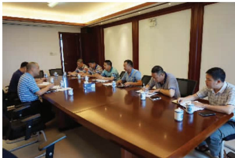
■与基层分局负责人开展谈心提醒座谈会

神,深化“四风”整治,继续在全市安全监管系统开展收送“红包”礼金、公车私用和违规公款吃喝、违规发放津贴、打高尔夫球等问题整治,对存在苗头性、倾向性问题的及时进行谈话提醒,有针对性引导对照检查,提出整改要求。