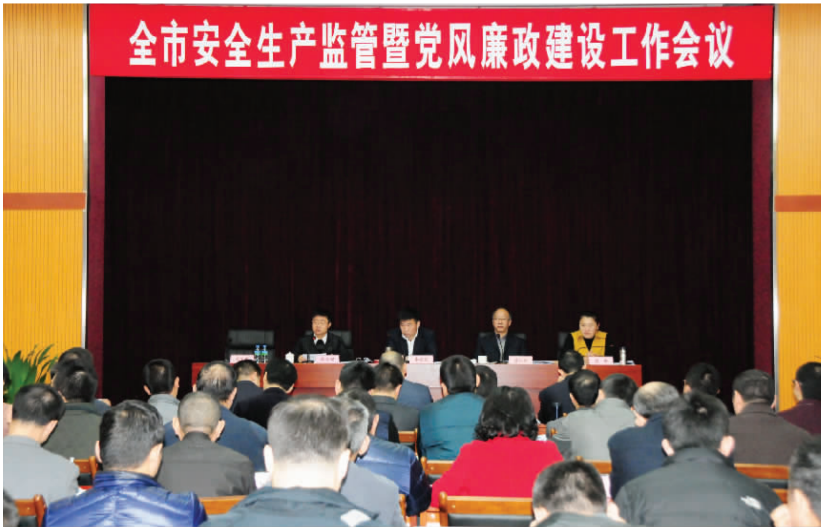
■全市安全生产监管暨党风廉政建设工作会议

群众的意见和建议,注重从日常工作中挖掘违纪线索。通过综合运用和把握好“四种形态”,加强初核初查,力争做到问题“早发现、早提醒、早纠正”,让“抓早抓小”成为全市安全监管系统纪检监察工作的常态。