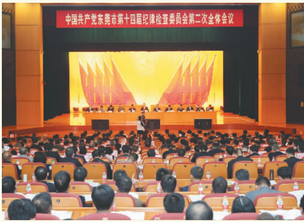
中国共产党东莞市第十四届纪律检查委员会第二次全体会议昨日召开