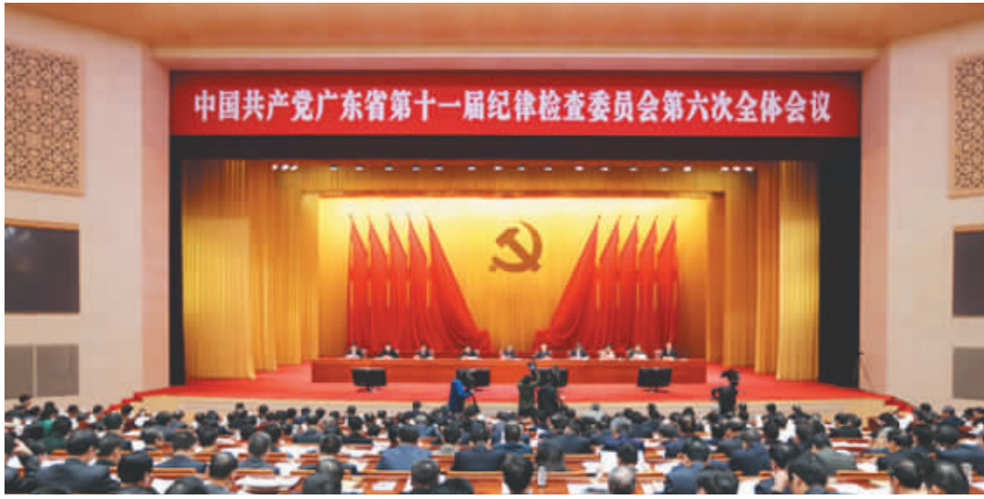
16日,省委书记胡春华出席省纪委十一届六次全会并讲话

胡春华强调,要认真抓好今年我省党风廉政建设和反腐败工作。要以永远在路上的战略定力和政治定力,综合运用监督执纪“四种形态”,深化“以案治本”工作,持续巩固反腐败斗争压倒性态势。要全力打好作风建设这场持久战攻坚战,深入研究“四风”问题新动向新特点,坚持暗访、查处、追责、“四管齐下”,进一步健全改进作风长效机制。要强化巡视巡察和派驻监督作用,以党章党规党纪为尺子,聚焦党的领导、全面从严治党,深入查找政治偏差,坚决维护习近平总书记的核心地位,坚决维护党中央权威。要认真落实中央换届工作部署,坚持党管干部原则不动摇,严把政治关和廉洁关,确保换届风清气正,取得圆满成功。要打造过硬纪检监察队伍,认真执行好《中国共