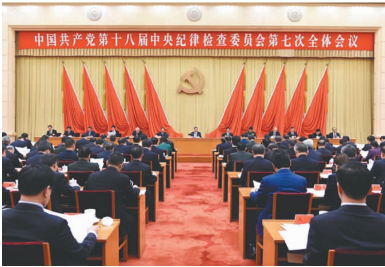
中国共产党第十八届中央纪律检查委员会第七次全体会议，于2017年1月6日至8日在北京举行

习近平指出，经过全党共同努力，党的各级组织管党治党主体责任明显增强，中央八项规定精神得到坚决落实，党的纪律建设全面加强，腐败蔓延